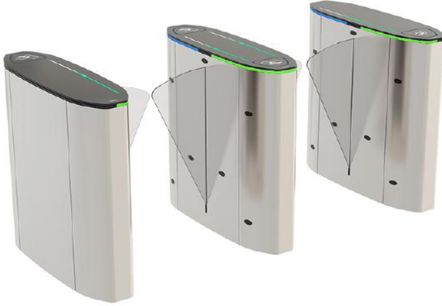
HG 02 GL-S : SINGLE ÜNİTE (SOL ya da SAĞ)